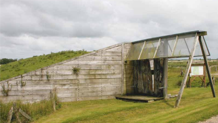
Deich- und Sielmuseum Neukirchen