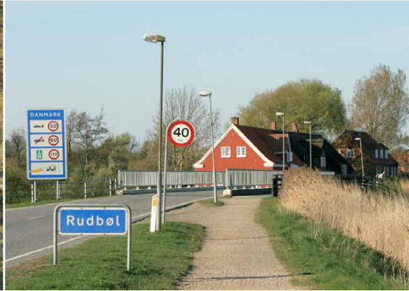
Deutsch-dänischer Grenzübergang Rudbøl