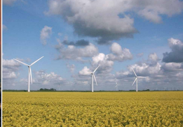
Rapsfeld im Sönke-Nissen-Koog