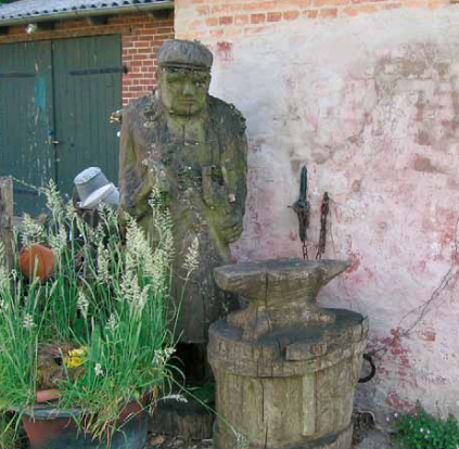
Alte Schmiede Lütjenholm